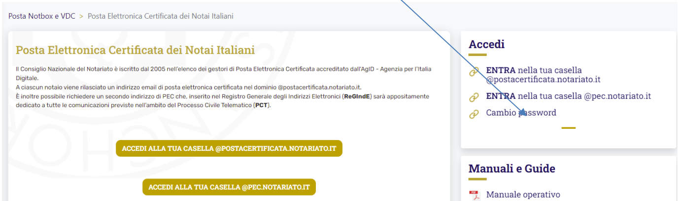
Figura 3 Pagina relativa al servizio

Una volta entrati nella pagina relativa al servizio cliccare su