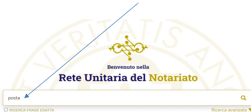
Figura 1 accesso RUN

Per cambiare la propria password è disponibile una specifica applicazione online, dalla home page della RUN digitare nella stringa di ricerca "posta"