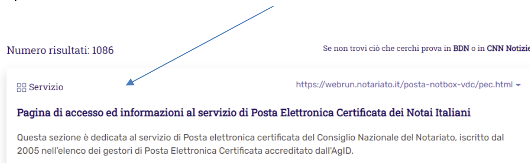
Figura 2 accesso al servizio "posta"

Dopo aver cliccato sulla lente cliccare su della scheda relativa al servizio